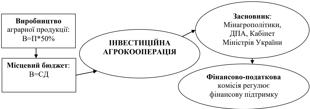
Рис.4. Фінансування інвестиційної діяльності за умов створення інвестиційної агро корпорації

Виникає необхідність формування фінансових механізмів інвестиційної діяльності аграрного виробництва регіону, а разом з ними і якісно нового підходу до характеру і критеріїв інвестиційної підтримки, що забезпечують ефективний розвиток регіонів (рис.4).