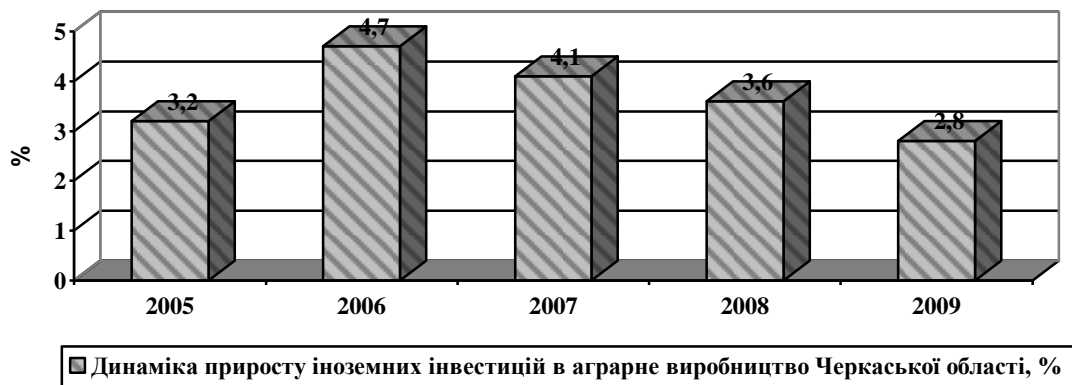
Рис.2. Динаміка приросту іноземних інвестицій в аграрне виробництво Черкаської області, %

Оцінено динаміку приросту іноземних інвестицій в аграрне виробництво регіону. Найвищу частку склали іноземні інвестиції у 2006 році (рис. 2).