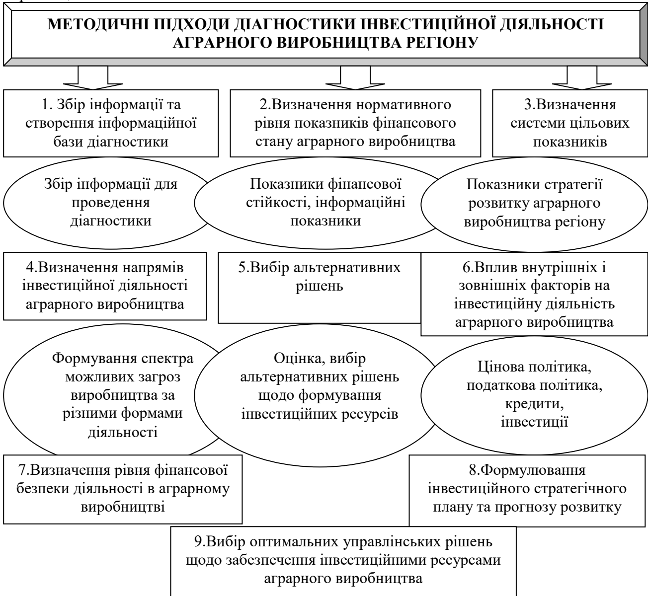
Рис. 3. Методичні підходи діагностики інвестиційної діяльності аграрного виробництва регіону

Важливою перевагою й прикметною відмінністю даних методичних підходів від існуючих є те, що вони дають можливість чітко виявити реальні можливості інвестування аграрного виробництва.